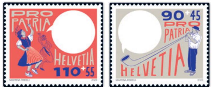
Timbres Pro Patria 2023 © Post CH Netz AG

Le Forum Helveticum a été sollicité par la Fondation Pro Patria pour participer à l'élaboration des timbres Pro Patria 2023 autour du thème « Culture du dialogue ». Ces timbres, qui contiennent des bulles de parole vides, invitent à cultiver la diversité linguistique de manière ludique : ces bulles sont en effet destinées à être remplies, soit à la main par les utilisateurs et utilisatrices, soit par des autocollants déjà préparés contenant des expressions et des salutations dans les quatre langues nationales. Le FH a fait des propositions pour l'allemand, le français et l'italien.