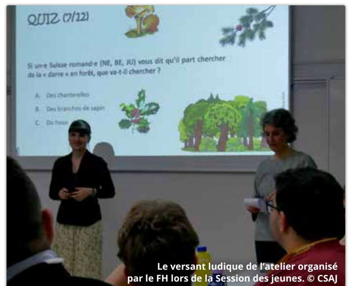
Le versant ludique de l'atelier organisé par le FH lors de la Session des jeunes.