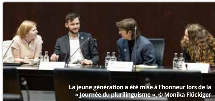
La jeune génération a été mise à l'honneur lors de la « Journée du plurilinguisme ».

Le 29 septembre a eu lieu la 4 ème édition de la « Journée du plurilinguisme » au Parlement, une manifestation initiée en 2019 par Helvetia Latina en collaboration avec les intergroupes parlementaires Plurilinguisme CH, ITALIANITÀ et Lingua e cultura rumantscha. L'objectif de cette journée est de promouvoir l'échange et la compréhension entre les différentes communautés linguistiques de Suisse et de valoriser la richesse linguistique et culturelle du pays.