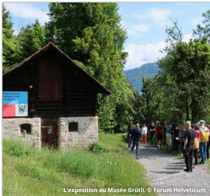
L'exposition au Musée Grütli.

Cette année encore, le public a pu visiter l'exposition « Helvétismes – Spécialités linguistiques », et ce dans un lieu à la fois pittoresque et mythique. C'est en effet le Musée Grütli (le plus petit musée de Suisse, mais certainement pas le moins connu !) qui accueille actuellement « Helvétismes ». Réalisée en 2019 par le Centre Dürrenmatt Neuchâtel (CDN) en collaboration avec le FH et avec le soutien de différents partenaires, l'exposition présente de manière à la fois instructive et ludique les particularités linguistiques des langues nationales de Suisse. L'inauguration a eu lieu le 14 mai 2022 ; l'exposition restera dans ce lieu historique jusqu'à la fin de l'année 2023. Rappelons que précédemment, de mars à début mai 2022, l'exposition se trouvait à La Chaux-de-Fonds (NE).