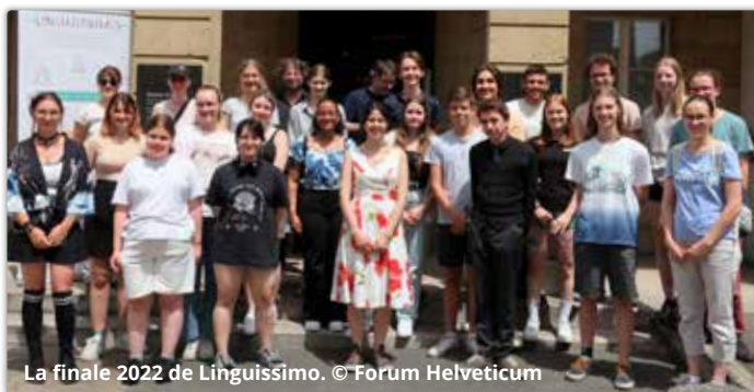
La finale 2022 de Linguissimo.

Le taux de participation de l'édition 2022 a enregistré une légère baisse par rapport à l'année précédente, avec 351 inscriptions (2021 : 385 ; 2020 : 273) et 255 textes soumis (2021 : 283 textes ; 2020 : 231 textes). Il faut toutefois préciser que 2021 a été une année record en termes de nombre de textes soumis. En 2022, le nombre élevé de contributions a été d'autant plus réjouissant que pendant la période de soumission, la variante omicron du Covid-19 circulait dans de nombreuses écoles. Notons enfin que 19 cantons ont été représentés durant ce premier tour du concours.