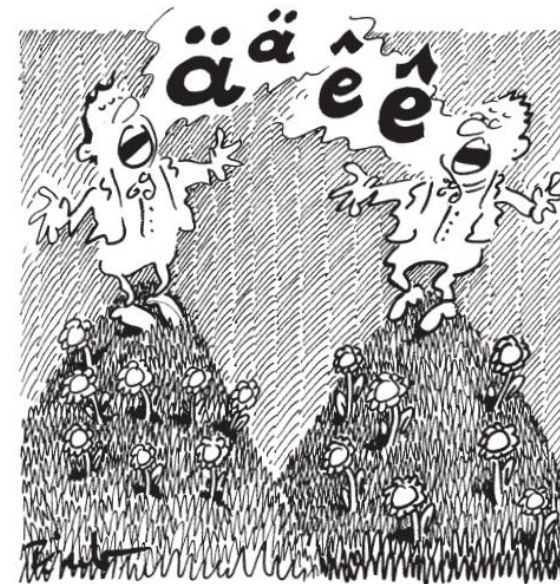
Zeichnung von Pécut aus der Publikation „Dialekt in der (Deutsch)Schweiz – zwischen lokaler Identität und nationaler Kohäsion“ des Forum Helveticum (2005)